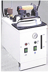
PRATIKA sans caisson

Caractéristiques techniques : 230 v. CE Cuve INOX capacité totale : 5 l Capacité utile : 3,5 l Résistance monobloc : 1700 w. Tube niveau d'eau. Electrovanne à débit réglable. Autonomie : environ 4h00 Pression d'exercice : 3 à 3,5 bar. Vanne de vidange. Caisson monté sur 4 roulettes pivotantes.